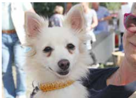
Fini – alias Prinzessin Edelweiß