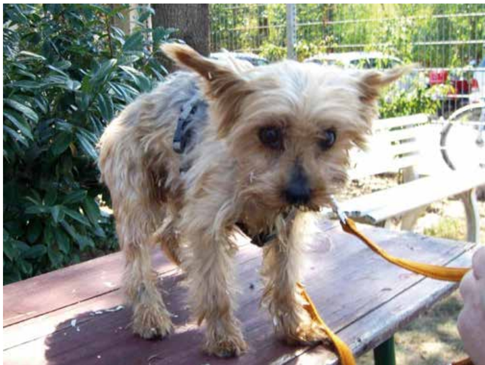
Völlig verängstigter Jorkie