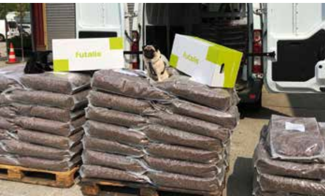
Alles Futter für unsere Tiere ...