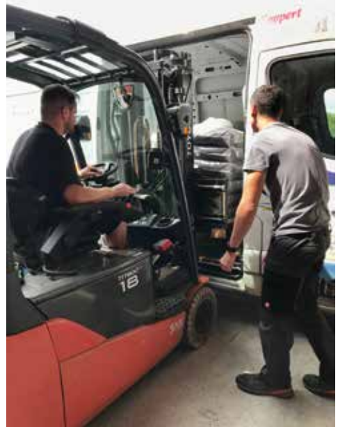
Das Futter wird verladen