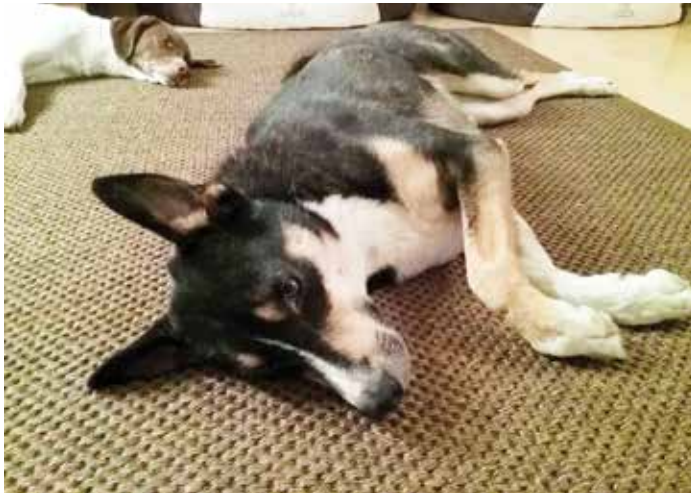
Mahoni und seine Freundin