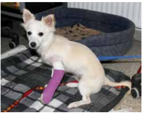
Sissi mit gebrochenem Bein

Sie sehen, liebe Tierfreunde, die Arbeit können wir bewältigen, aber die Kosten steigen ins Unermessliche und wir benötigen Ihre Hilfe. Vielleicht ist es eine Idee, an Weihnachten oder zu Geburtstagen „Tierschutz“ in Form von „Tierheim-Patenschaften“ zu verschenken.