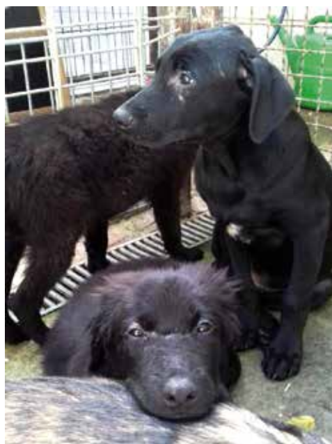
Völlig verwahrloste und kranke Welpen

mit ihren fünf Welpen, sie bewohnt ein Freigehege bei uns, ist völlig verunsichert. Wenn sie sich mal aus dem Gebäude traut, hat sie immer den Eingang zum Haus im Blick, um bei der kleinsten, für andere Hunde natürlichen Bewegung oder einem