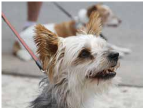
Sultan – fasziniert vom Glücksrad