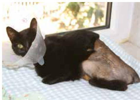
Adina nach Hüft-OP