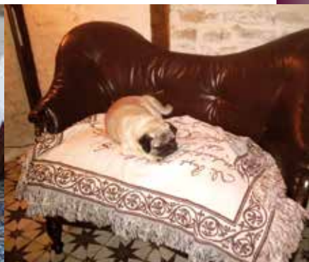
... oder stilvolles Nickerchen