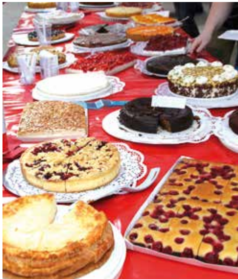
Kuchen soweit das Auge reicht

Neben unserem beliebtesten Stand, dem Kuchenstand, gab es auch eine Ecke mit italienischen Köstlichkeiten. Am Sonntag wurde das Angebot noch um einen Stand