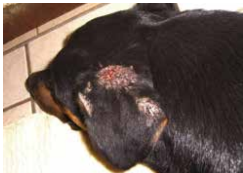
Offene Wunden an den Ohren