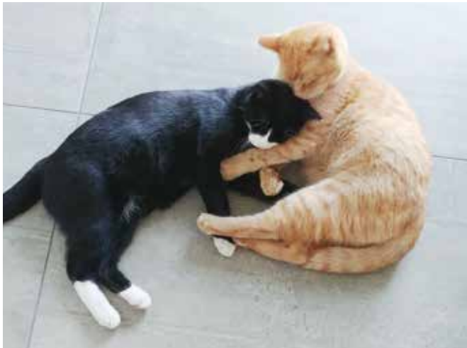
Mogli und Garfield

Wir haben uns immer viele Gedanken um die beiden gemacht, aber sie haben uns sehr viel Freude gebracht und bringen uns immer wieder zum Lachen. Garfield (Krümel) lässt sich noch immer nicht oder