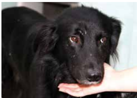
Schüchternes Border-Collie Chipsy

den ersten Blick keine gesundheitlichen Beeinträchtigungen.