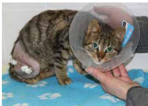
Samira nach Oberschenkel-OP