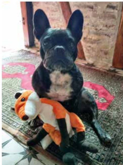
Joy mit Fuchs

Und meine Freundin Claudia kam sichtlich erholt aus dem Urlaub zurück. Schön, wenn man mal Kraft tanken kann,