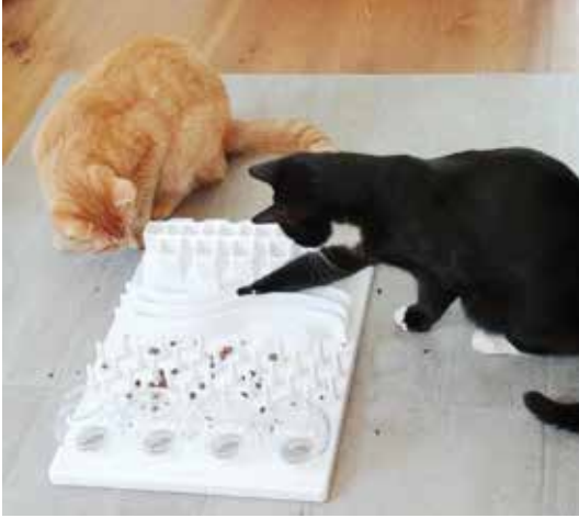
Spass am Fummelbrett

Katze sollte die Chance bekommen ihr Leben in Frieden und Freiheit genießen zu können. Auch scheue Katzen sind in jeder Hinsicht liebenswert und haben menschliche Fürsorge sogar noch nötiger als ihre aufgeschlossenen Artgenossen, die