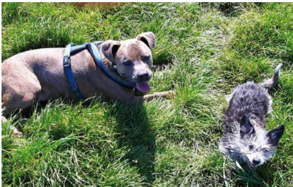
Odin und Ronja

Im Allgemeinen ist Odin sehr aufgeschlossen und freundlich seiner Umwelt gegenüber. Manchmal müssen wir ihn schon bremsen, da er sonst vor Freude zu ungestüm ist. Dies ist im Laufe der letzten Wochen auch schon wesentlich