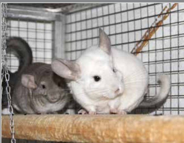
DIE CHINCHILLAS CHAP, CHOP, CHICO UND RONGO