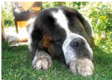
Nach dem Toben

Ich bin das Ganze sehr entspannt angegangen und siehe da, die 12 Tage wurden für alle Beteiligten zur richtig entspannten Auszeit. Mal raus aus dem Alltag, mal ganz neue Eindrücke, Gerüche und neue Action genießen.