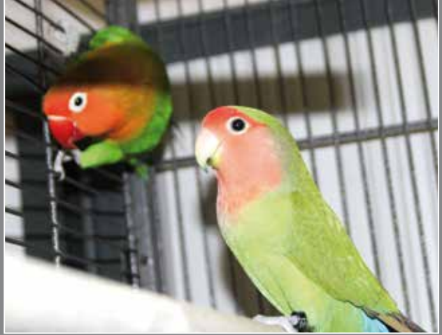
DIE AGAS ABBY UND EDDIE