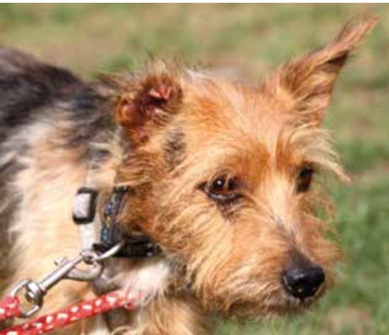
Lino mit abgebissenem Ohr

Geräusch, das sie nicht kennt, panisch den Rückzug anzutreten.