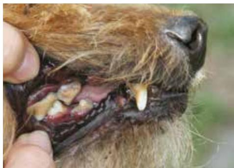
Zahnstein und Zahnfleischentzündung bei Jorky Rocky