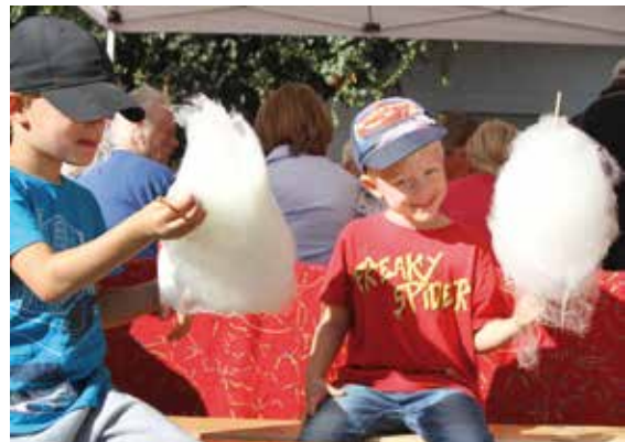
der Kampf mit der Zuckerwatte

mit türkischen Köstlichkeiten erweitert, der innerhalb von ein paar Stunden ausverkauft waren. Aber auch der Bratwurst- und Steak-Stand der „Tierhilfe ohne Grenzen“ hatte alle Hände voll zu tun.