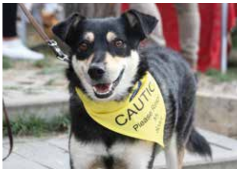
Der dreibeinige Billy

Dafür möchten wir uns ganz herzlich bedanken!