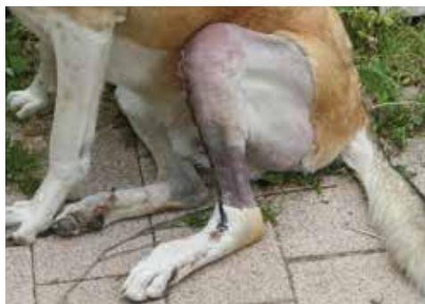
Kreuzbandriss bei Herdenschutzhund