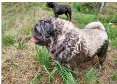
Wellness mit Schlammpackung

Abkühlung dann ein Schlammbad nehmen ... ganz nach dem Motto: Der Hund braucht sein Hundeleben. Er will zwar am liebsten ganz dicht mit dem Menschen auf dem Sofa kuscheln, aber die Möglichkeit